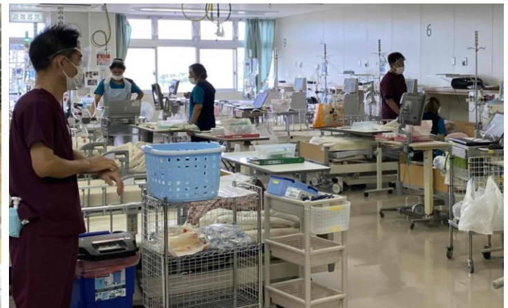
現在の本館3階にある透析室