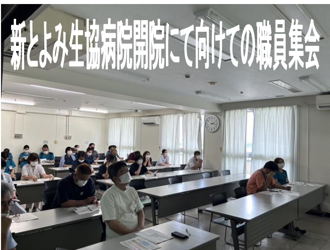
新とよみ生協病院開院に向けての職員集会

9月22日に行われた集会では新病院の各階の見取り図を確認する事が出来ました。さらに今後の事業説明に合わせて健診利用者の増加と外来をスタートする事が聴けました。そして新たな放射線機器の導入など、とても希望の持てる内容でした。リハビリ室も各病棟に設置され、これまで以上に効率よくサービス提供が出来ると思います。新しい病院でのリハビリの質の向上で多くの方にサービスを提供できるように頑張りたいと思います。