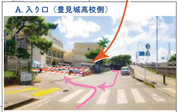
A. 入り口 (豊見城高校側)