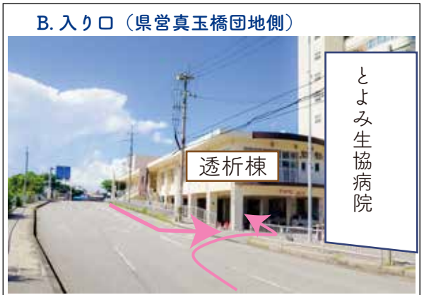
B. 入り口 (県営真玉橋団地側)