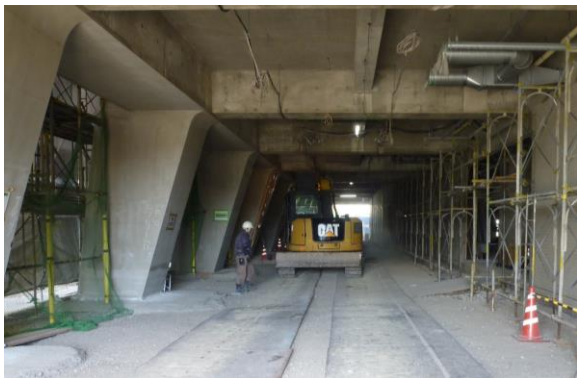
正面玄関 ピロティ県道11号線側より撮影