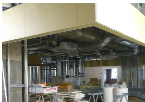
6階病棟スタッフステーション周辺